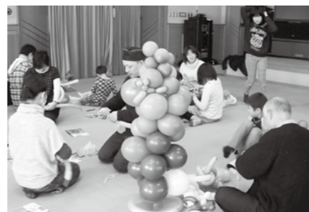
サロンいちごの会での活動

ライフサポートいちご の活動についてお知らせします。私たちのグループは、学童期から思春期・青年期の支援を必要とする子どもと家族を対象に、参加者同士が「つながる」ことを目的としています。 私たちは、茶話会・相談会・体験活動・余暇活動などさまざまな行事を企画し、次のような活動を行っています。 ■サロンいちごの会…小学生と家族が対象。毎月第一土曜日、午前10時から開催 ■小中学校特別支援学級保護者のつどい…毎月1回、総社ふれあいセンターに