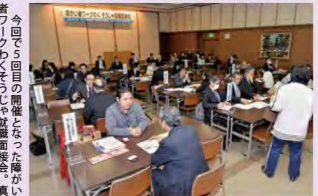
今回で5回目の開催となった障がい者ワークわくそうじゃ就職面接会。真剣に担当者の説明に聞き入った

これからも市では、障がい者の雇用1000人に向け、応援していきます。 問い合わせ 福祉課障がい福祉係 (☎ 8269)