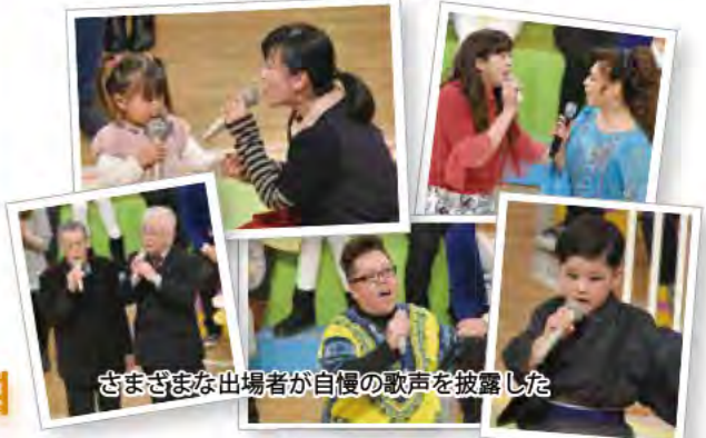
さまざまな出場者が自慢の歌声を披露した

NHK 公開録画 うた!自慢 放送日 [NHK総合・中国地方向け] 2月26日(金) 午後7時30分～8時43分 (鳥取・山口を除く) 2月27日(土) 午前10時5分～11時18分 (再放送) 予選会 [KCT] 3月6日(日) 午前7時～正午 (再放送あり)