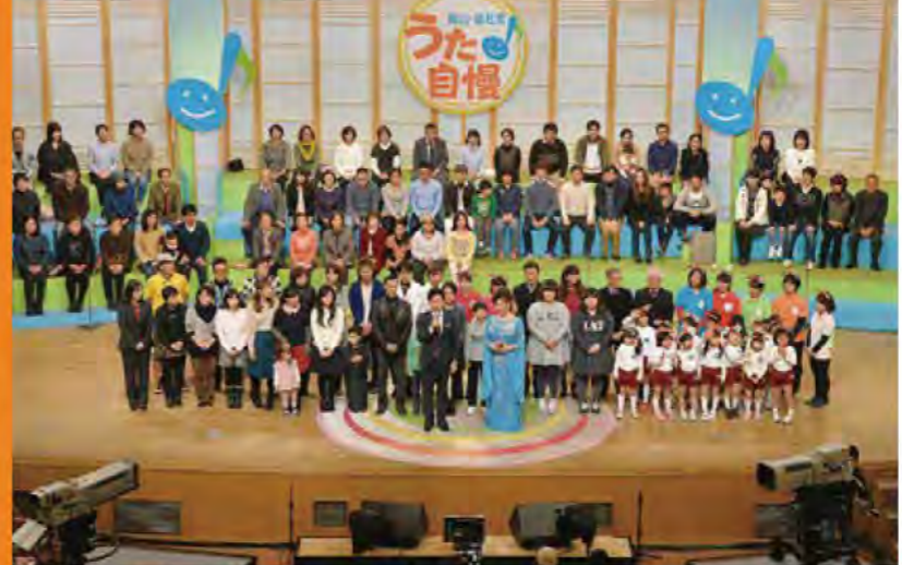
出演者と応援団がステージを盛り上げる

NHK 公開録画 うた!自慢 放送日 [NHK総合・中国地方向け] 2月26日(金) 午後7時30分～8時43分 (鳥取・山口を除く) 2月27日(土) 午前10時5分～11時18分 (再放送) 予選会 [KCT] 3月6日(日) 午前7時～正午 (再放送あり)