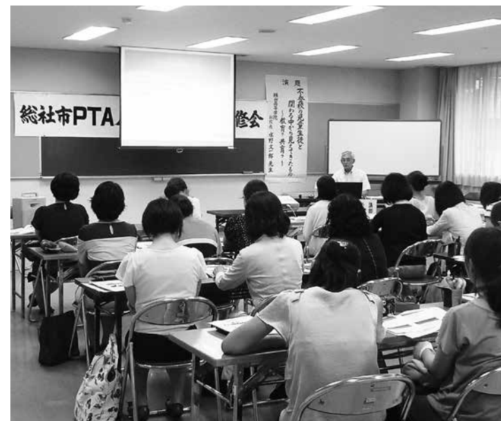
PTA 人権教育担当者研修会（左）、巡回ふれあい講演会（右）