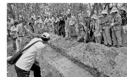
茶臼嶽古墳現地説明会