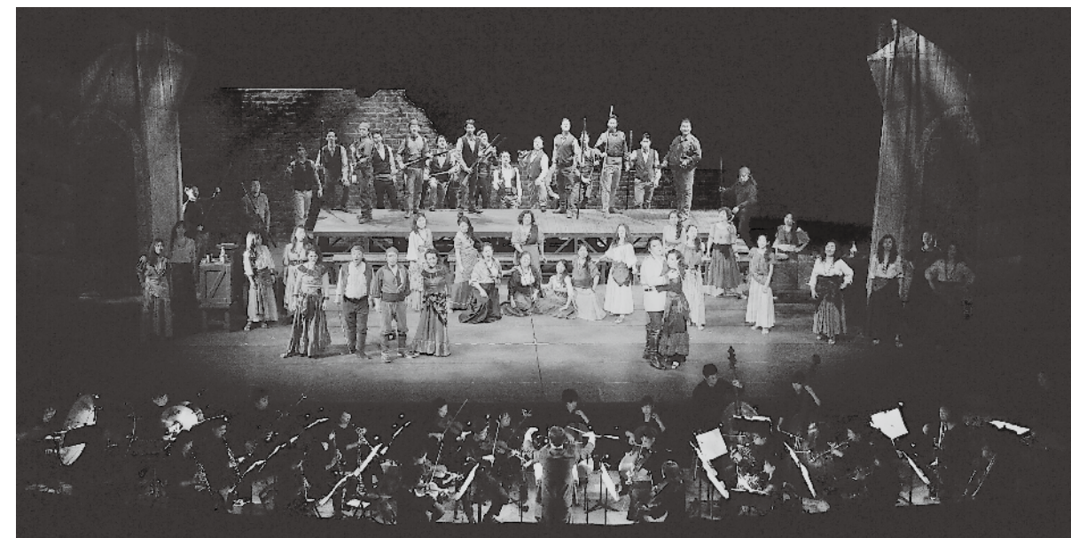
第2回総社芸術祭の事業の一つ「はじめてのオペラカルメン」