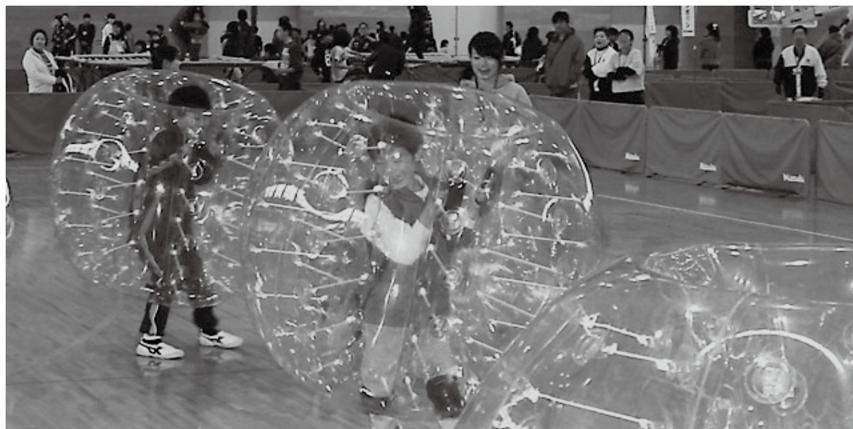
わくわくフェスティバル（スポーツ体験）