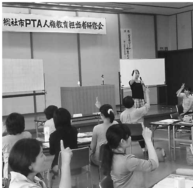
人権教育指導者育成講座(左)、PTA人権教育担当者研修会(右)