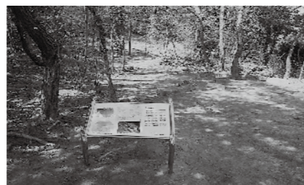
鬼ノ城礎石建物群の説明板