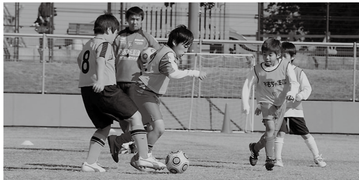
わくわくフェスティバル（スポーツ体験）