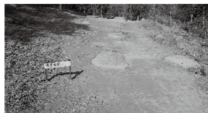
鬼ノ城礎石建物群の名称板

整備にあたっては、遺跡の保存を第一とし、来訪者の理解を深めるため、わかりやすい表示に努める。