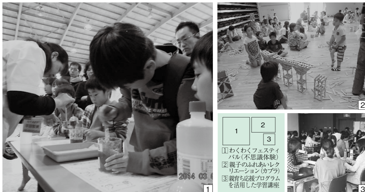
1 わくわくフェスティバル(不思議体験) 2 親子のふれあいレクリエーション(カプラ) 3 親育ち応援プログラムを活用した学習講座