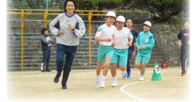
川崎医療福祉大学の先生から学ぶ (池田小)