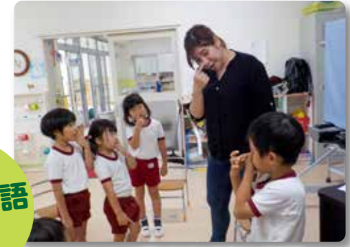
外国人の先生と遊びます (幼稚園)