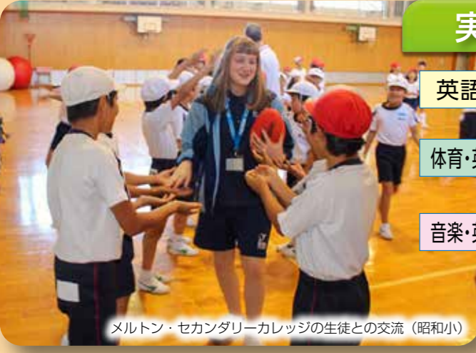
メルトン・セカンダリーカレッジの生徒との交流（昭和小）