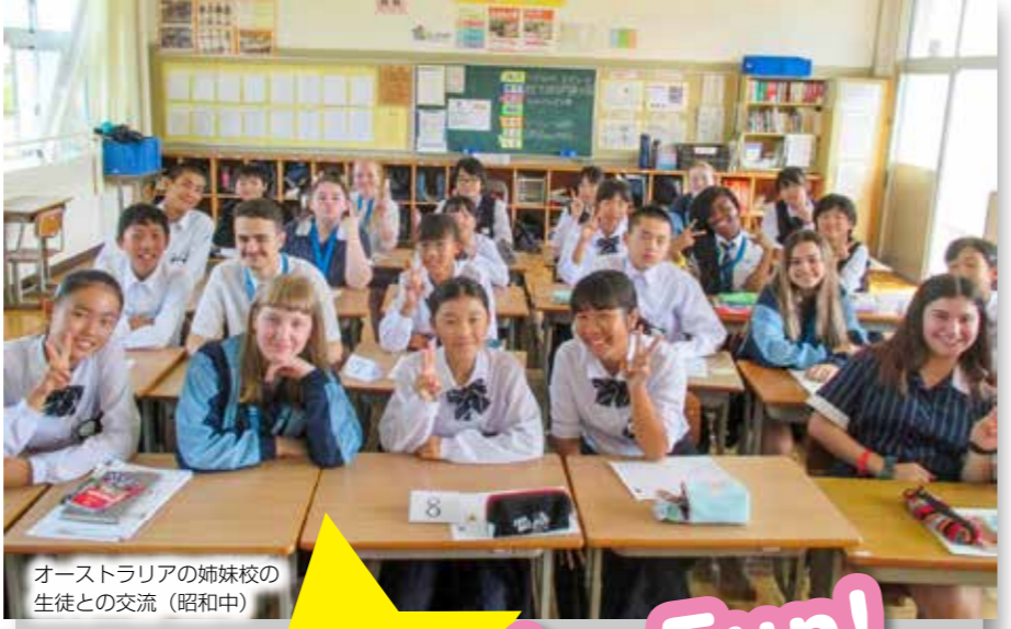
オーストラリアの姉妹校の生徒との交流（昭和中）

3 少人数指導や個に応じた指導により、小学校卒業時に英語検定4級レベル、昭和中学校卒業時に英語検定2級レベルの英語力を目指します。