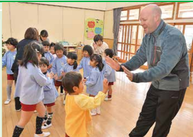
A L T (外国語指導助手) と楽しく英語を学ぶ新本幼稚園の園児ら

平成26年度から昭和地区などでスタートしている「英語特区」。平成28年度から新本地区では「音楽・英語特区」、池田地区では「体育・英語特区」が始まります。これらの特区では、市内のどこからでも、また市外からでも就園・就学することができます。総社市の教育特区で、楽しく学んでみませんか。