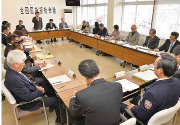
昨年12月3日に市役所で開催された、全国屈指福祉会議の初会合

今後、各部会ごとに話し合いを進め、2月中旬までに2回目の全体会議を開催。それぞれの分野で数値目標を設定し、来年度の一般会計当初予算案に盛り込んでいく予定です。