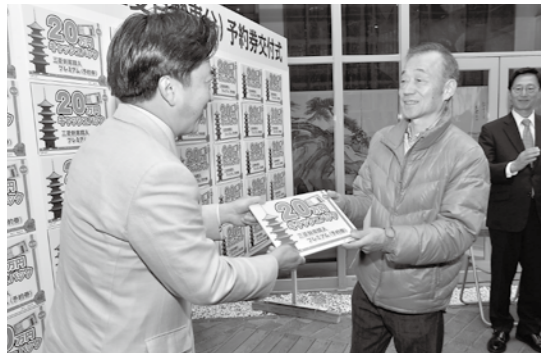
3月23日から三菱自動車購入プレミアム付商品券の予約券を交付した

3月定例市議会が3月2日から20日までの19日間の会期で開かれ、条例の制定議案が1件修正可決、平成27年度当初予算（6ヶ月関連記事）や平成26年度補正予算など50案件は原案どおり可決・同意などされました。平成27年度一般会計当初予算の総額は261億3000万円。主な事業は、本庁舎トイレ・玄関・外壁改修事業に1億円、地域づくり一括交付金に7575万円、生活困窮者自立支援事業に3001万円、認定こども園整備事業に8513万円、図書館エレベーター設置事業に7765万円などです。 平成26年度一般会計補正予算は6億9400万円の増。国と県からの地域活性化・地域住民生活等緊急支