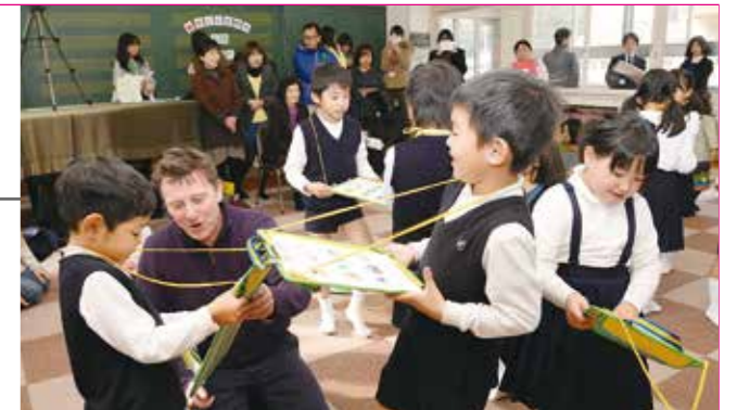
12月3日に行われた昭和小学校のオープンスクール