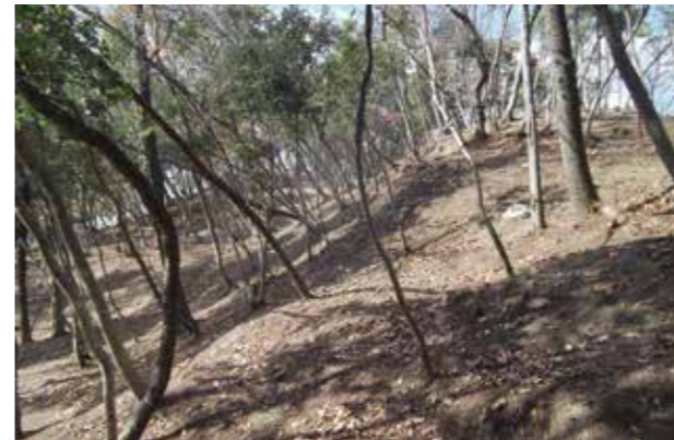
茶臼嶽古墳。手前右の盛り上がりが前方部、左奥は後方部（写真上）。岡山大学考古学研究室が3次元（3D）測量調査で作成した図面（写真右）

市教育委員会は11月25日、市内秦地内に全長約65mの前方後方墳が見つかったと発表しました。前方後方墳としては市内では、同じ秦地内にある平成23年に確認された二丁塊1号墳に