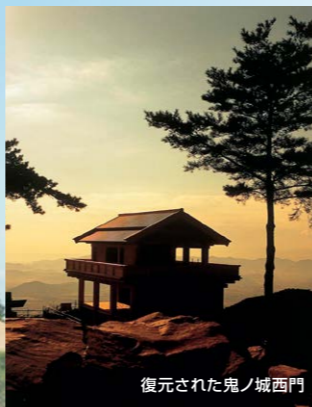
復元された鬼ノ城西門

墳丘の全長約350m、全国4位の規模を誇り、立ち入りできる古墳では国内最大。徒歩で上れば、大和朝廷に匹敵したという吉備王国の高度な技術やスケールを体感できる。