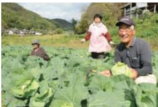
学校給食用のキャベツを収穫する生産者

属する農業公社きびの里が担っています。この取り組みは地産地消だけでなく、小規模農家の生産意欲向上や、遊休農地の活用などの効果も期待されています。