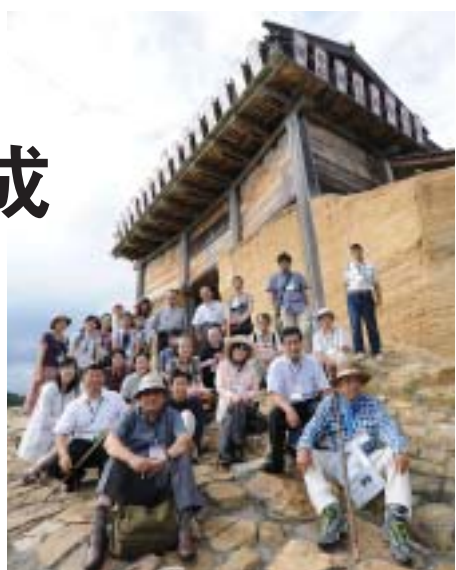
総社観光大学の受講生。鬼ノ城西門前で

総社の観光とその魅力を学ぶ「総社観光大学」を8月22日から26日までの5日間、岡山県立大学を主会場に開講しました。