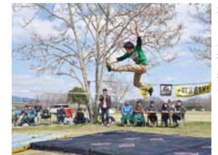
迫力ある演技を披露

スラックラインの経験が3年未満の選手を対象とした全国大会が3月22日、そうじゃ水辺の学校で開催されました。県内外から男女41人が参加。ジャンプや宙返りなど迫力ある技に、来場者から歓声があがっていました。