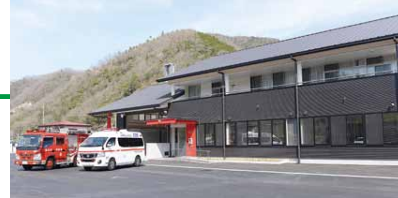
完成した新消防署昭和出張所。鉄骨造2階建て、延床面積約613平方メートル、総事業費3億6622万円。消防職員16人が配属されている

細い道が多い昭和地区に適したサイズの救急車を新たに配置。また、緊急時に職員が出動しやすいよう、自動オートロック装置が設置されるなど、地域住民の生命・財産を守る体制が充実しました。