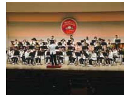
心の込められた演奏

SKYMジュニア・ウインドアンサンブルの定期演奏会が3月30日、市民会館で開かれました。「恋するフォーチュンクッキー」や「花は咲く」など12曲を披露。心地よい音色に訪れた300人の観客は魅了されていました。