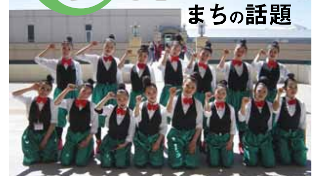
見事準優勝に輝いた、総社南高等学校のダンス部員