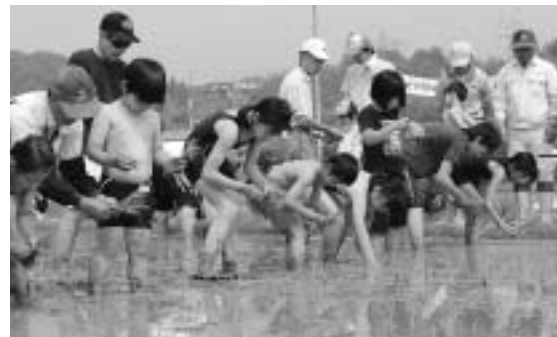
田んぼの学校の田植え。約8か月に及ぶ活動の始まりの行事で多くの子どもたちが体験していた

平 成14年以降、毎年開いていた総社北分館田んぼの学校を、1月のとんどをもって閉校しました。当初から10年計画で、ここで幕を引くことになりました。 田んぼの学校は、米作りを通して子どもたちの健全育成と地域の交流にと始めたものです。延べ約4000人の子どもが、手作業による田植えや稲刈り、自然観察を体