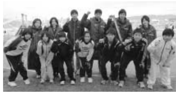
スタート前に「やるぞ!」と総社市チームのメンバー

県 内の市町対抗で争う第1回「晴れの国岡山」駅伝競走大会に、総社市もチームを組織して参加しました。 大会は1月29日、旭川・百間川ランニングコースに9区間42.195kmを設定して開かれ、各チーム、中学生から一般までの男女が、郷土への思いを胸にたすきをつないで走りました。 私は多くのロードレースに出てきた経験を生かし、主将として若い選手にアドバイスすることに徹し、テーピングやレース前のアップ