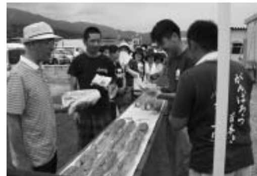
総社ドッグを振る舞う慰問隊

地 震や福島第一原発の影響で避難生活を送る人々へ少しでも元気を届けたいとの思いで、被災地慰問隊を結成し被災地を訪問しました。7月2日には宮城県柴田町を、3日には福島県桑折町の避難所を訪ねました。いずれも市内の企業のグループ会社があるまちです。慰問隊は私たち総社青年会議所をはじめ備中温羅太鼓、商工会議所青年部のメンバーなど