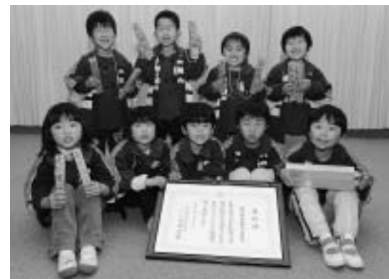
柴田賞の賞状を持ってにっこの園児たち

維新 新幼稚園幼年消防隊は、火の用心の約束を守り火災予防にがんばったと、岡山県消防協会の柴田賞という立派な賞をいただきました。 昭和61年に発足し、代々、火災予防を呼び掛ける活動をしてきました。その長年の活動が評価されての表彰だと思いい、この地域みんなの喜びです。 現在の幼年消防隊は全園児の9人です。この一年、消防署を訪ねて消防車や救急車の役割を勉強しました。また、11月から12月にかけて2回、「火の用心 マッチ一本火事のもと」と声をそろえ、拍子木をたたきながら学区内を約2時間かけてパトロールしました。 地域の皆さんからも「毎年、子どもたちのパトロールを楽しみにしています」との声をいただき、子どもたちの励みにもな