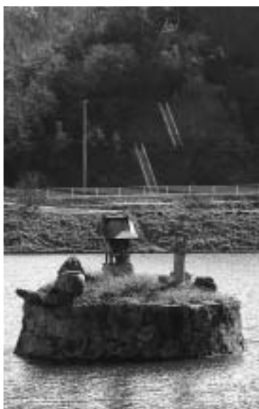
弁天様は、七福神の弁財天のこと。もとは、土地に豊穡をもたらすインドの水神様のこと。本名はサンスクリット語でサラスバティー「水多き地」という意味だそうです。日本では、お金(財福)の神様として有名。

島は弁天島と呼ばれ、水の神様として信仰されている弁天様と、その脇には江戸末期の石灯笼が祀られています。毎年、田植前の5月17日には、大池の水を利用する人たちが、水がきれいになることと豊作になるように祈念して、お参りをしています。今でも、池の岸に笹竹を2