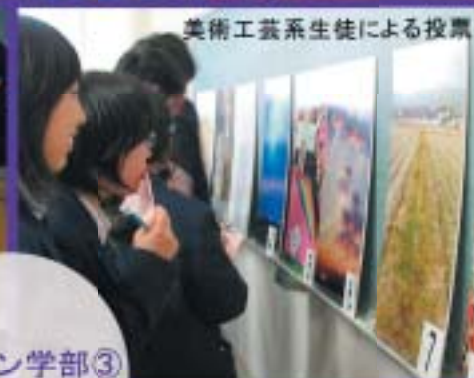
美術工芸系生徒による投票