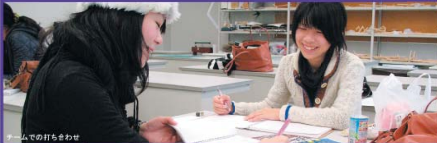
チームでの打ち合わせ

3月3日～8日デザイン学部 卒業修了制作展(岡山県天神山文化プラザ)デザインを学んだ学生の集大成となる卒業修了制作展を開催します。テーマは「ZOOM」です。実際に触れることができる作品など、多彩な展示を行います。その他、ギャラリートークやワークショップも開催します。ぜひ会場に来て、学生が県立大学で学んだことを感じてください。観覧無料です。