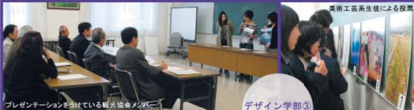
プレゼンテーションをうけている観光協会メンバー