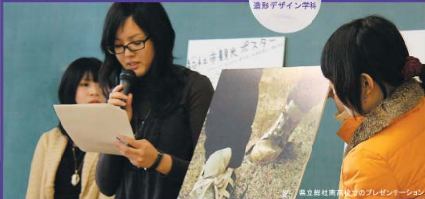
岡山県立総社南高校でのプレゼンテーション