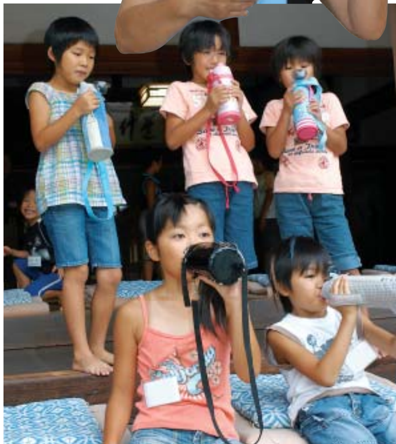
8月4日に宝福寺で行われた雪舟体験学習の休憩時間、お茶を飲む子どもたち