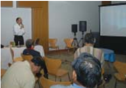
鬼ノ城塾の講義の様子

見 延子供会では、岡山自動車道の見延橋に4月21日、今年もこのぼりをあげました。大きき色も違う25のこのぼりが、優雅に泳ぐ姿は、壮観なものです。 平成9年に岡山自動車道が開通。その年の4月にこのぼりをあげて以来、今年で11回目です。すっかり恒例行事として定着しました。 橋げたの下までは約70mの高さがあります。ロープにこのぼりをしっかりとくくり、大人20人と子ども22人が力を合わせてロープを引っ張ると、天に登るようにするすると登っていききました。7mもあるこのぼりでも、あがると本当に小さく見えます。5月12日まであげていましたが、縦一列に泳ぐのはめずらしいようで、ドライフがてら見に来る人もいるようです。 今年も6人の新一年生が子供会に入りました。このこのぼりのように仲良く元気に遊び、健やかに成長してほしいと思います。 (平田博彦さん・見延)