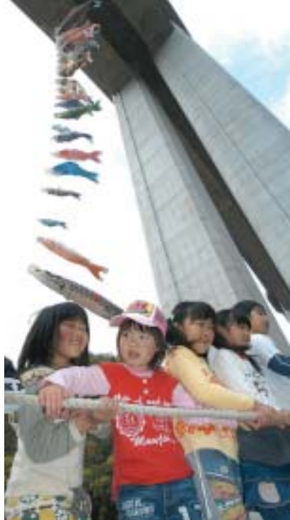
みんなでロープを引く

して以来、まちづくりや古備文化について学ぼうと、鬼ノ城の麓にあるゴルフ場のクラブハウスで、鬼ノ城や古代古備などをテーマに毎年6回程度、講義を開いてきました。 今年のテーマは「古備の鉄」。6回の講義を通じて、鉄について学んだり議論したりしながら、11月4日、奥坂の児童公園で本授業する「6世紀の古代たたら操業Ⅱ」