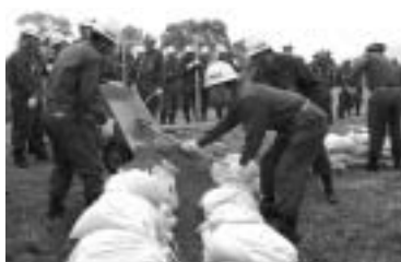
昨年行われた水防訓練

また、日ごろから防災意識を持つことも大切です。先月各戸へ配布した「総社市洪水ハザードマップ」を使って家庭や地域で話し合いを行い、避難場所や避難経路、非常持ち出し品などを確認しておきましょう。