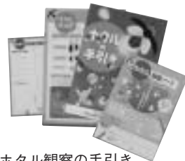
ホタル観察の手引き

4月18日、備中県民局管内でホタルを守る活動に取り組んでいるグループが昭和公民館に集まり、ミーティングが開かれた。ホタルを増やし守っていくために、参加者は情報を交換し、熱の入った話し合いが行われた。ホタルが飛び交う川、ひいては清流や里山を守っていくこととしている。