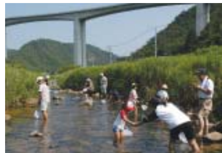
横谷川で水生昆虫を採取する参加者

毎年7月下旬に横谷川で行っているイベント。小学生の親子が参加する。参加者で水生昆虫を採取し、その種類や数などを判定表と照らし合わせ、川の水の汚れ具合を判定する。