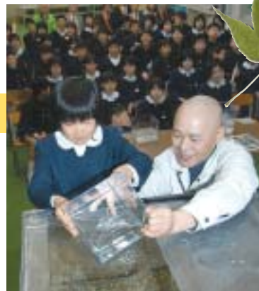
学校の水槽に、スイゲンゼニタナゴを放した(昨年4月。総社東小学校)

市内の小学校では、環境に関する学習をさまざまな形で取り組んでいる。総社東小学校では昨年、専門家の指導のもとスイゲンゼニタナゴの観察を始めた。これをきっかけに、メダカの調査や川の水質を調べた。意外に川が汚れていることを知り、「川をきれいに！川にごみを捨てないで！」と書いた看板を立てた。