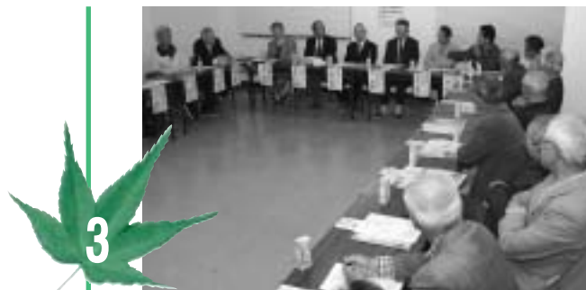
活発な意見交換が行われた