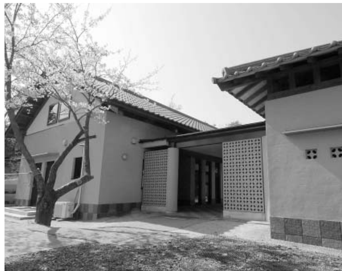
鬼城山ビジターセンター 左奥が6月中旬にオープンする展示棟

鬼ノ城は「日本書紀」など古代の文献にその名が登場しない謎の古代山城。6月中旬に、この鬼ノ城をわかりやすく解説した展示棟がオープンします。