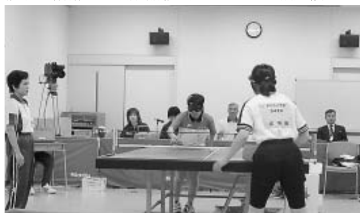
第3回全国障害者スポーツ大会（静岡）サウンドテーブルテニス競技の様子

で、毎年国体の開催後に行われるものです。正式競技は全13競技で、11月に岡山で行われる大会では、総社市での卓球競技のほか、岡山市で7競技、倉敷市で5競技が開催されます。 問い合わせ 国体室障害者スポーツ大会係（☎08373）