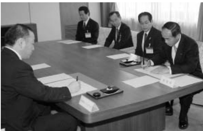
災害緊急放送に関する協定締結式

市内の災害情報がケーブルテレビで見られるようになりました。いざというときの情報収集手段の一つとしてご活用ください。