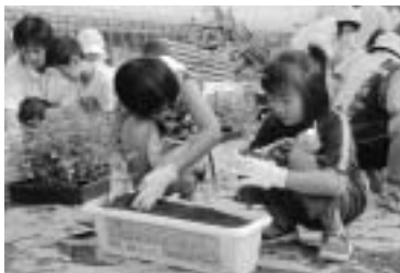
ペタンク会場となる清音ふるさとふれあい広場で花いっぱい運動を展開。清音地区約250人が4000本の花を移植した(9/18)