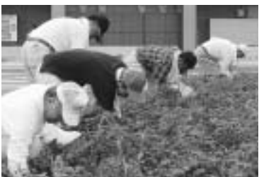
県内一斉国体クリーン作戦で、きびじアリーナ周辺の清掃活動。この日約200人の市民が汗を流した(9/4)