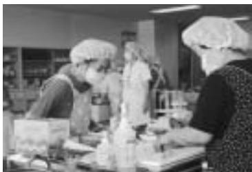
総社市保健センターで三須、服部地区の約30人が参加し、民泊の献立調理実習を行った(9/14)

花いっぱい運動など多くのボランティアの皆さんの力によって作られます。この大会がすべての人にとって心に残るすばらしいものにするために、力一杯の応援、ご協力をお願いします。そして、市外からのお客様に温