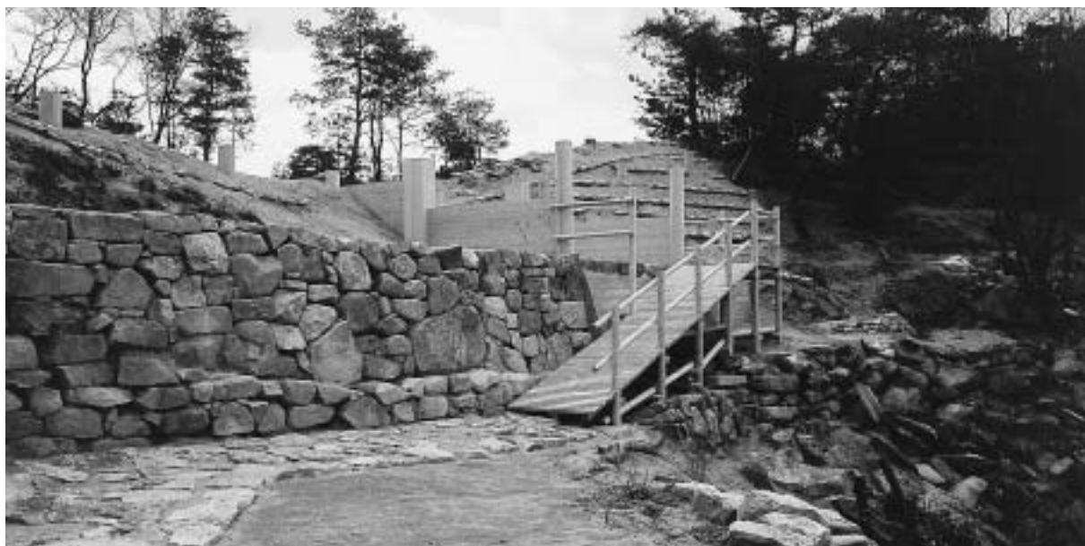
平成18年度に整備された鬼ノ城の北門