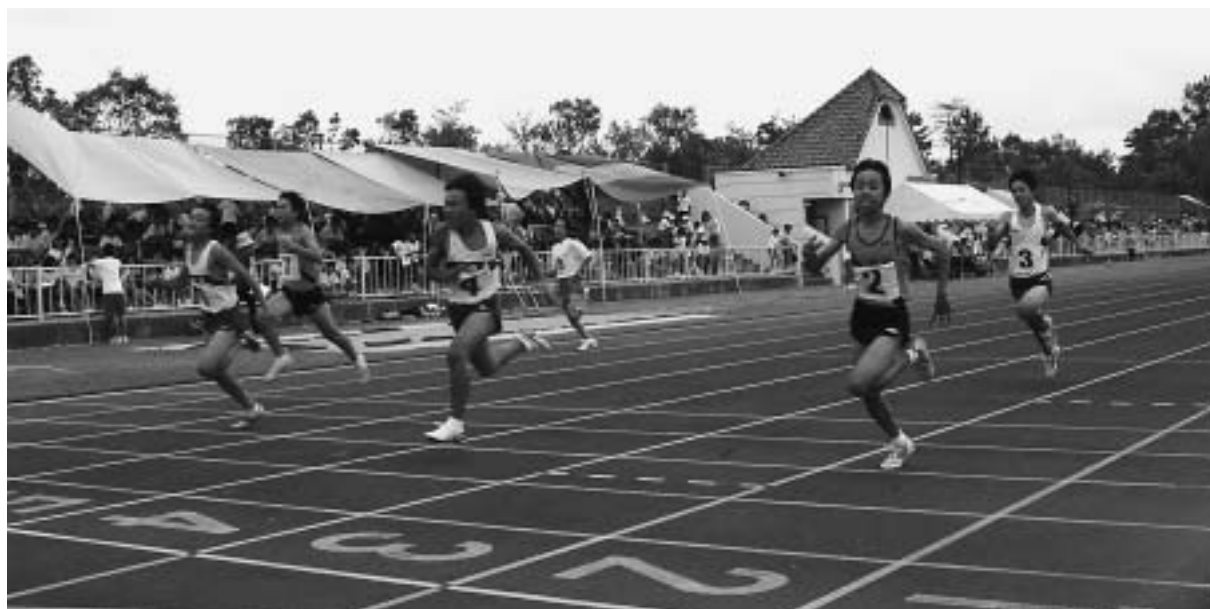
市民総合スポーツ祭