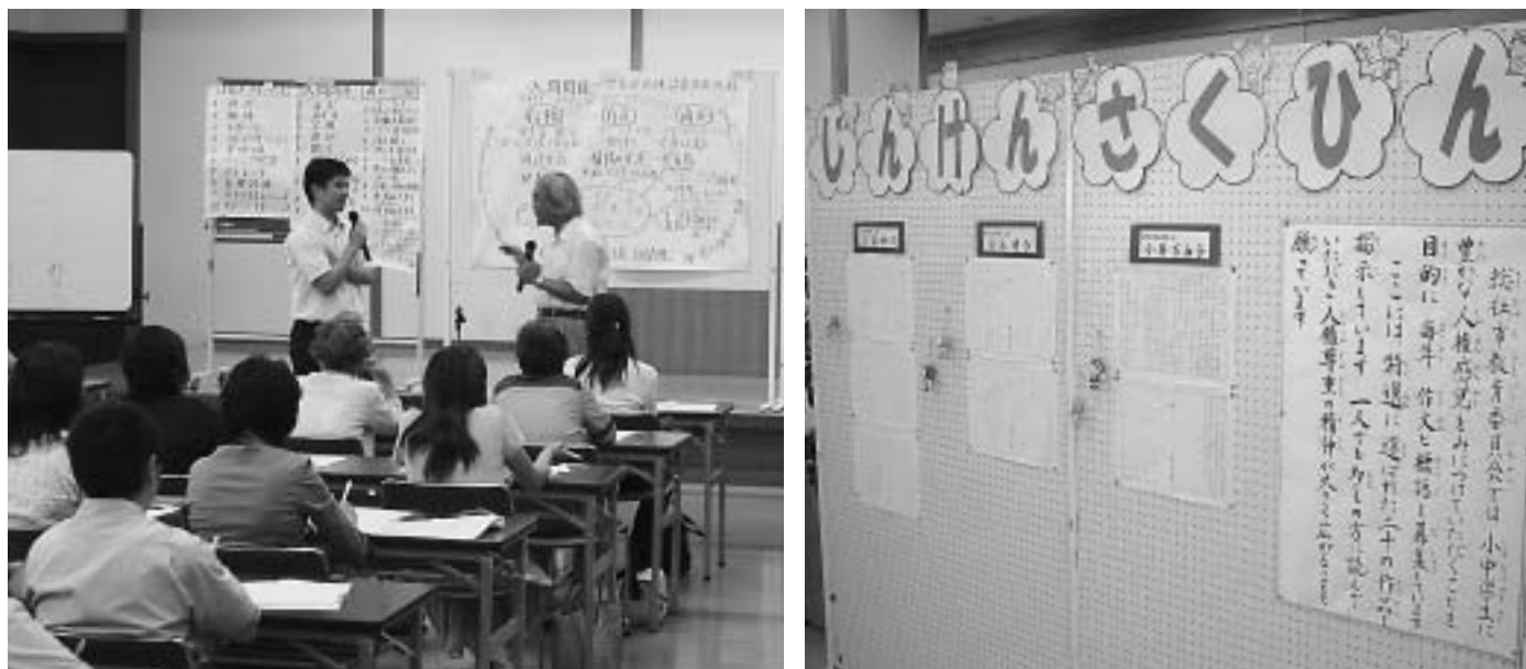
人権教育指導者育成講座(左) 人権作品展(右)