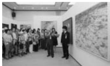
墨彩画公募入選作品展

国民文化祭の気運を盛り上げ、主催事業を実施 雪舟の里総社 墨彩画公募展の入選作品展の開催 総社市文学選奨（詩、短歌、俳句、川柳、小説、童話） サマーミュージックフェスタの開催