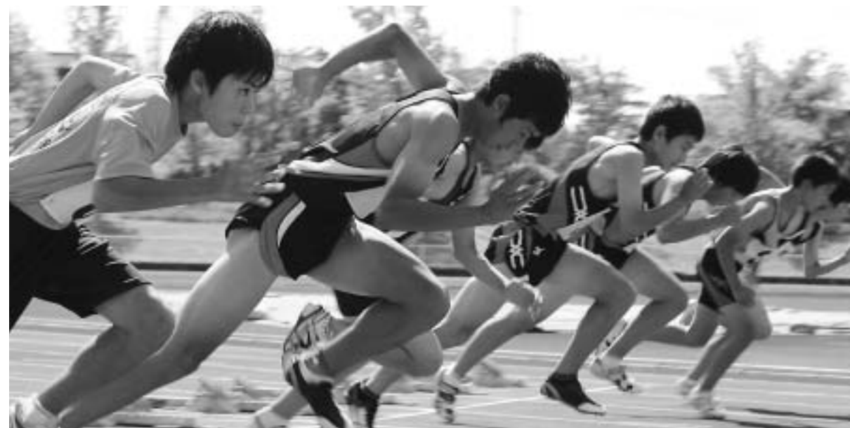
市民総合スポーツ祭