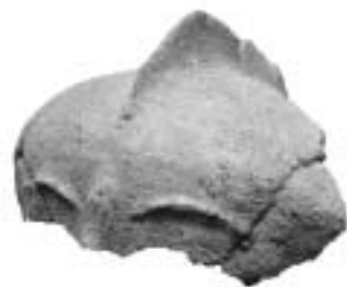
上原遺跡から出土した人面土製品。人頭大のものとしては全国初の出土