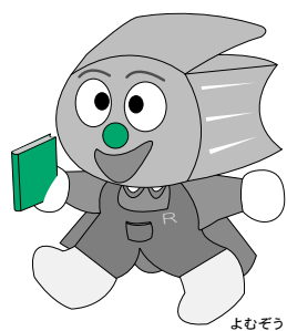
よむぞう 子ども読書活動推進 マスコットキャラクター 「よむぞう」