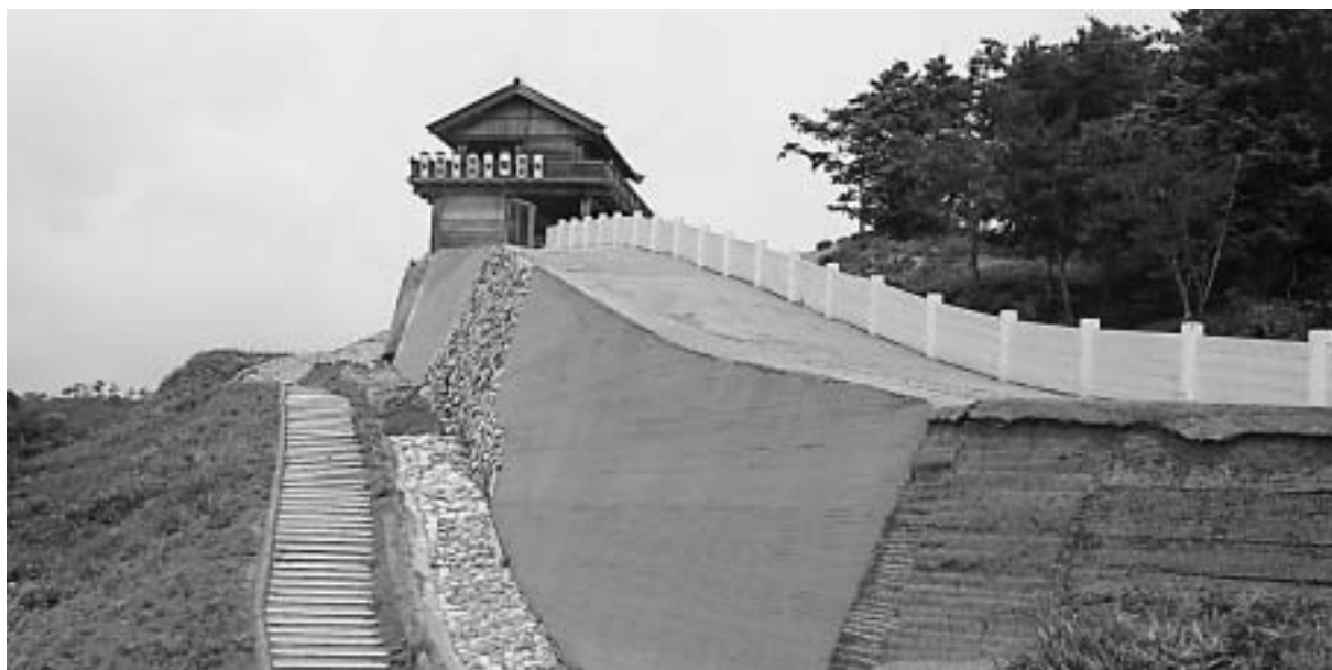
鬼ノ城の西門から第0水門付近。土塁やその上部の板塀、敷石、遊歩道が完成し、平成23年春の復元完了をめざす