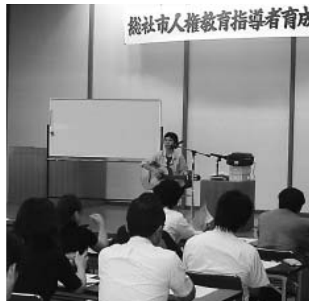
巡回ふれあい講演会（左）、人権教育指導者育成講座（右）