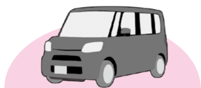
▼軽自動車（二輪車を除く）

住所変更の手続きを行わないと、住所変更前の市区町村で課税されます。廃車や所有者・住所などが変わるときは、速やかに届け出をしましょう。 車の種別ごとの手続き先・問い合わせは、以下のとおりです。