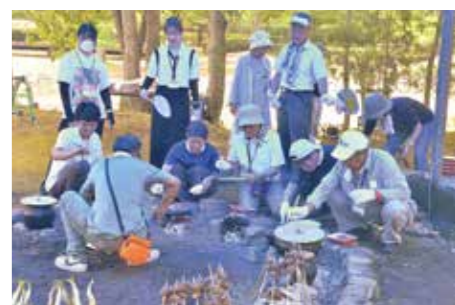
石の上で肉を焼く受講者

総社のことは人一倍知っ ているつもりでしたが、い ざ座学や体験講座を受ける と、知らないことばかり。 印象的だったのは、古代食 の体験でした。忠実に再現 された古代の道具を使っ て、イノシシやシカの肉な どを調理し、いただきました。 現代のような便利な道 具がない中、おいしい食を