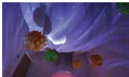
障がいの有無にかかわらず、心地よく過ごせる空間

スヌーズレンとは、主に 障がいのある人に光や音な どの感覚刺激で満たされた 空間を提供することで、心 や体をゆったり休め、思考 や行動などの変化を促す活