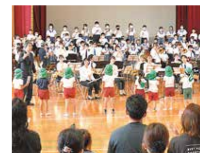
最後の曲では児童も演奏に参加

音楽・英語特区の新本小学校で5月28日、スクールコンサートが開催されました。児童や保護者らは、くらしき作陽大学・作陽短期大学の学生の演奏に合わせ、一緒に歌ったり手拍子を打ったりして楽しんでいました。