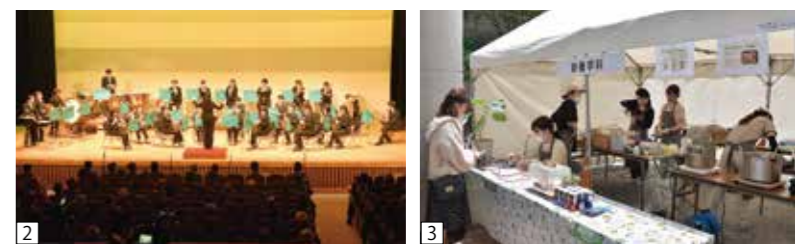
①華やかに執り行われた式典 ②学生による演奏で会場を盛り上げた ③野外テント・キッチンカーエリアで「地域の食」を提供