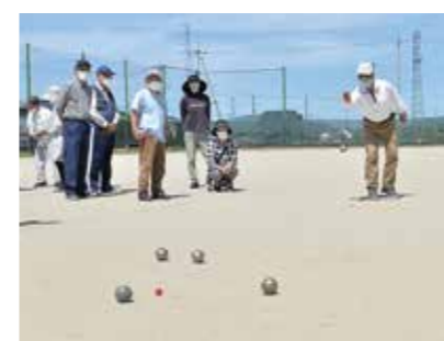
目印を掲げてボールを投げる

5月24日、高齢者の健康増進や親睦を深めることを目的に、市長杯ペタンク大会が市スポーツセンターで開催されました。同大会には18チーム54人が参加。参加者は、和気あいあいとプレーし、心地よい汗を流していました。