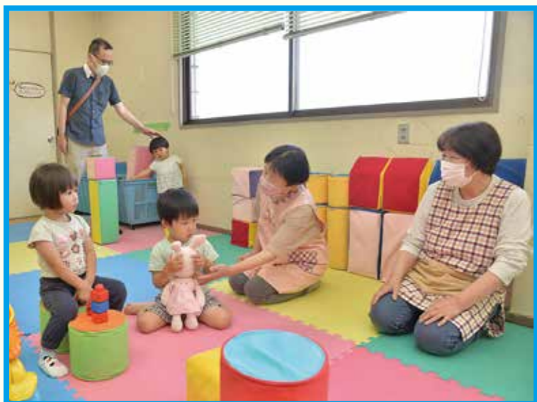
2・3歳児の利用の様子。楽しいおもちゃがたくさん

ファミリーサポートセンターでは、0歳児から高校生までの預かり・送迎を援助しています。初めて利用する人は、事前に入会手続きが必要です。手続きや料金については問い合わせください。