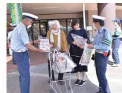
足を止め、熱心に耳を傾けていた

春の交通安全運動期間中の5月17日、天満屋ハッピータウンリブ総社店で交通安全啓発活動が行われました。市交通指導員らが啓発グッズを配布し、努力義務となったヘルメットの着用など、自転車の交通安全を呼び掛けました。