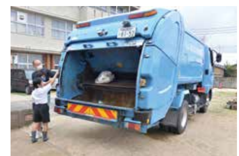
実際に操作してパッカー車を動かしてみよう

次に、体育館でゴミの分別クイズをしました。みんなで協力して、20個くらいのごみを分別しました。半分以上が正解だったけど、分別が難しいものもあって、勉強になりました。 最後に海ごみの話を聞きました。人間がポイ捨てしたごみが川を流れ、海ごみになっていくと知りました。海ごみを食べた魚を人間が食べることで、人間の体に悪い影響が出ると知って、恐ろしくなりました。魚などの生き物や人間が安心して暮らせるように、道端に落ちていくごみがあったら、拾いたいです。(神在小学校4年生)