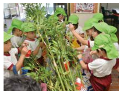
短冊や輪飾りを飾り付ける園児

6月7日、七夕飾りが総社商工会議所で行われました。参加した総社南幼稚園の園児32人は、願い事を書いた短冊や折り紙で作ったちょうちんなどをササに飾り付けたほか、七夕の歌を歌うなどして、楽しんでいました。