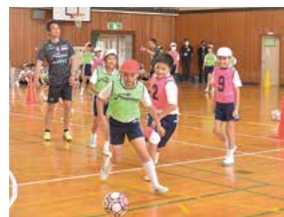
チームに分かれてミテーム

ファジアーノ岡山からコーチを迎え、6月6日、人権スポーツふれあい教室が総社中央小学校で開催されました。参加した同小の6年生68人は、サッカーボールを使ったゲームの中で、仲間を思いやることの大切さを学びました。