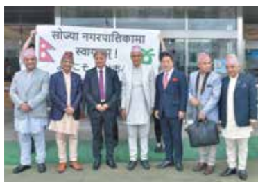
ケルラジュパンデイ市長（写真中央）ら6人の視察団を歓迎した