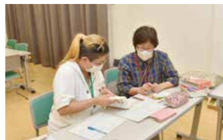
和やかな雰囲気の中、真剣に学ぶ受講生

そうじゃ「夜間中・学びの教室」に通い始めて2年目になります。私の場合、子どもに勉強を教えるときに自分自身の勉強不足を実感し、学び直したいと思ったのが、受講を始めるきっかけでした。 毎週木曜日の夜、2時間程、問題集やプリントを使って、国語と数学を中心に勉強しています。先生は、ほぼ一対一で納得がいくまで教えてくれて、学習内容について豆知識などで補足してくれることもあります。