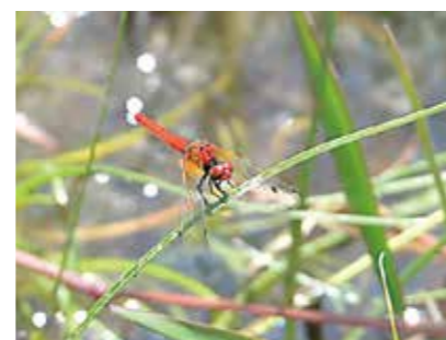
オスは鮮やかな赤色が特徴

5月中旬、ハッチョウトンボがヒゴ池湿地で確認されました。体長2センチほどで日本一小さく、県の準絶滅危惧に指定されているトンボですが、今年も愛らしい姿を見せてくれています。7月末まで観察できます。