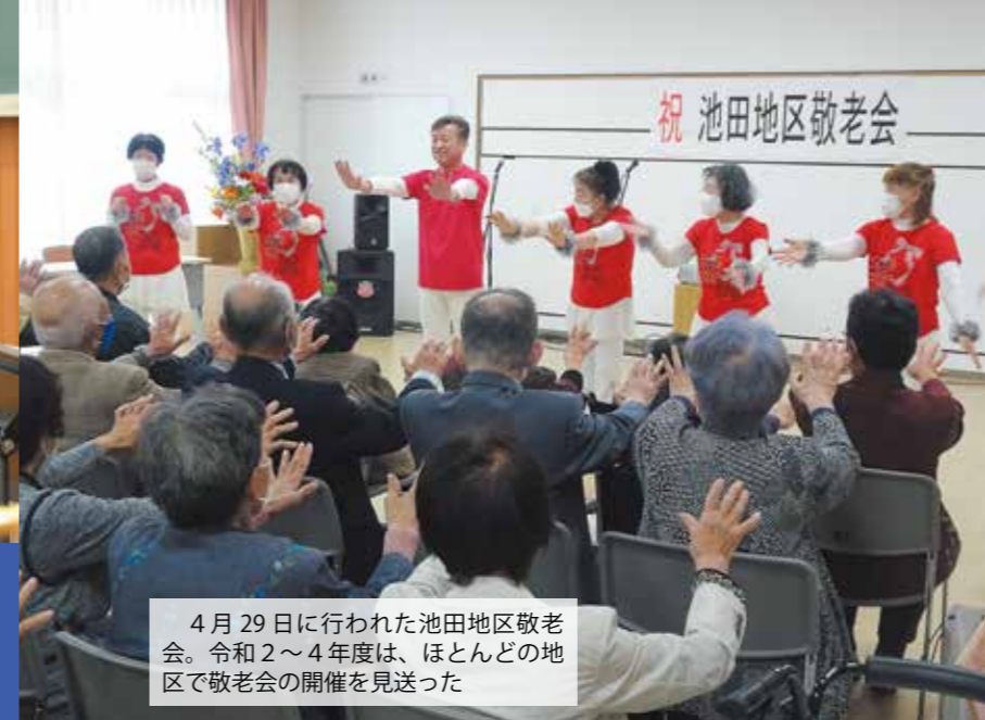
4月29日に行われた池田地区敬老会。令和2～4年度は、ほとんどの地区で敬老会の開催を見送った

5月8日、新型コロナウイルス感染症の感染法上の位置づけが季節性インフルエンザと同じ5類に変更されました。この変更により、3月にはマスクの着用と個人が判断することとされるなど、令和2年2月以降に始まったさまざまな制約が順次緩和されています。この春、市内各地では、これまで中止や延期、制限付きで開催などしてきた行事をコロナ禍のやり方に近づけて実施する動きが始まっています。