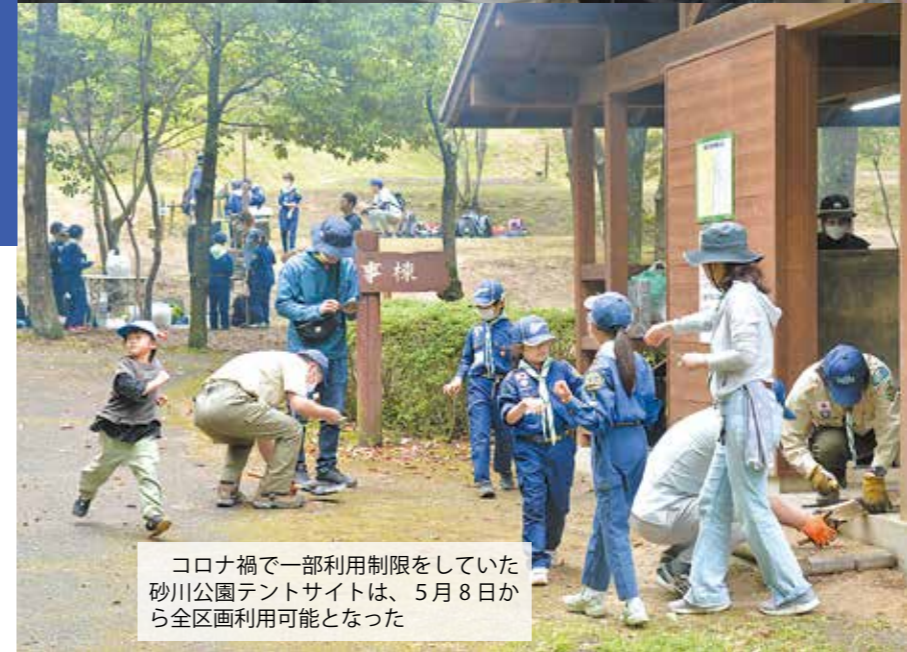
コロナ禍で一部利用制限をしていた砂川公園テントサイトは、5月8日から全区画利用可能となった