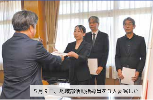
5月9日、地域部活動指導員を3人委嘱した

子ども どもたちが継続してスポーツ・文化活動に親しむ機会を確保することや教員の長時間労働解消などを目的に、昨年度から議論を進めていた市内中学校の部活動地域移行について、今年度、新しい形での部活動を開始しました。 地域の人を休日の部活動での指導者として配置するため5月9日、地域部活動指導員3人を委嘱しました。地域部活動指導員は、平日と休日の指導内容を互いに補い生かし合うよう、学校とよく連携しながら指導にあたります。 5月13日には、総社中学校と昭和中学校による合同部活動を開始。複数の学校による継続的な合同部活動は、市内で初の取り組みです。また、合同部活動の開始にあたり、総社中学校では男子バスケットボール部を、昭和中学校では女子バスケットボール部・野球部・卓球部・美術部・男子バレーボール部をそれぞれ新設。生徒の部活動の選択肢