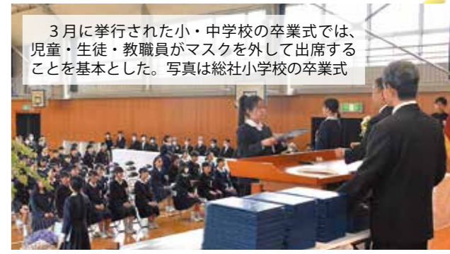
3月に挙行された小・中学校の卒業式では、児童・生徒・教職員がマスクを外して出席することを基本とした。写真は総社小学校の卒業式

5類 移行後の感染対策は、個人や事業者の自主的な判断となりますが、ウイルス自体が変わったわけではありません。引き続き、高齢者や妊娠している人、基礎疾患がある人など重症化リスクの高い人をウイルスから守るという視点をもつことが大切です。手洗いや換気など基本的な感染対策は継続しつつ、さまざまな活動を活性化していきます。 問い合わせ 新型コロナウイルス感染症対策室 (☎ 0866-92-8278)