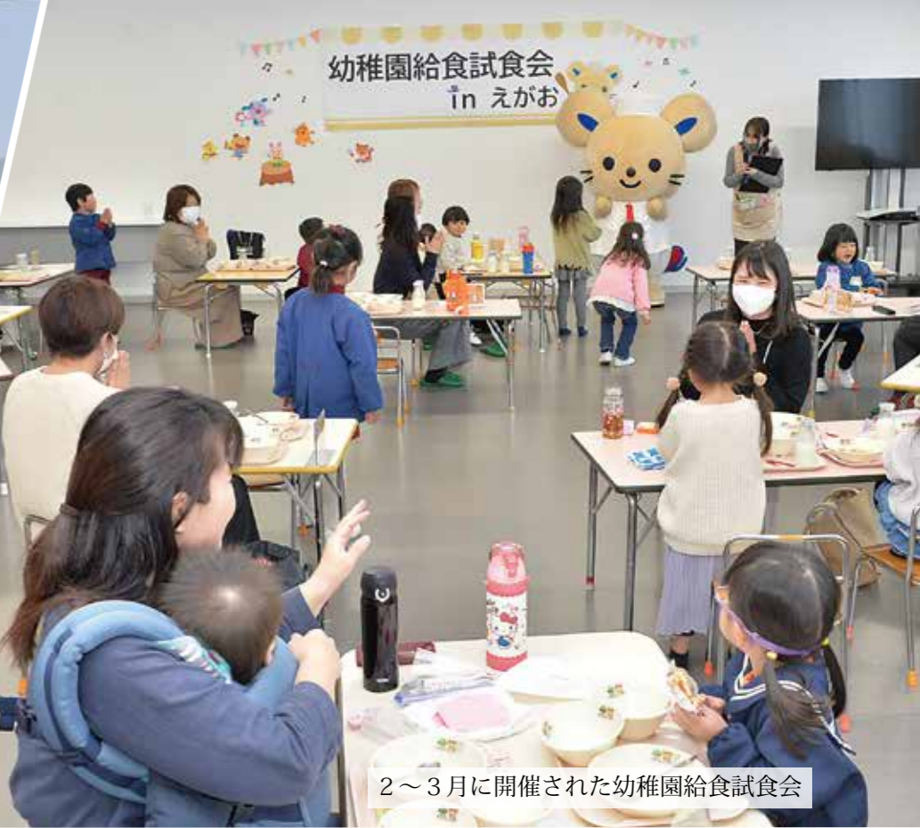
2～3月に開催された幼稚園給食試食会