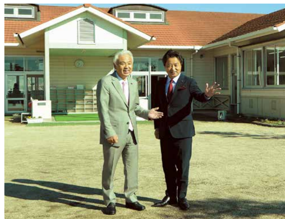
秦幼稚園で市政への思いを語り合った議長と市長

議長 市長の今年の抱負を聞かせてください。 市長 挑戦する気持ちを忘れないでほしいですね。これまで取り組んできた施策について、さらにレベルアップさせていきたいと思います。また、土地の活用で