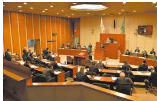
市議会では活発な議論が交わされる

市長 総社市は、議会と行政でテンポよく施策を作り上げていくと感じています。議場での質問に対して、行政側が即決して形になったものが多数あります。 議長 議員の発言を真つぐ受け止め、迅速に对应していたらいいと思います。市議会としても、市から提出された議案を迅速に審議するために、専門性を高め