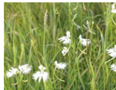
風に揺られるサギソウ

8月上旬から9月上旬まで、ヒイゴ池湿地でサギソウが見頃を迎えています。岡山県レッドデータブックで準絶滅危惧Ⅱ類に指定されているサギソウ。かれんな白い花は、訪れた人の目を楽しませてくれます。