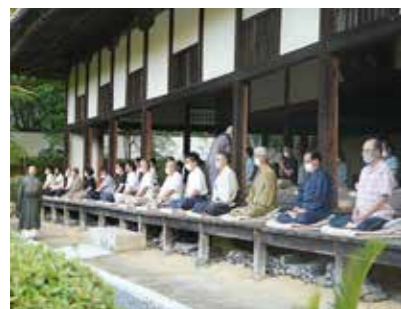
心を落ち着かせて

8月1日から5日にかけて、井山宝福寺で暁天座禅が行われました。初日には約50人が参加。午前5時から1時間、静まり返った境内で、参加者は座禅を組み、精神を統一させ、自分と向き合っていました。