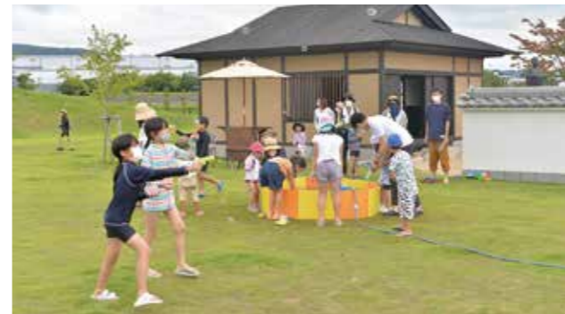
猛暑の中、水遊びを楽しむ子どもたち

7月23日から8月13日までの毎週土曜日に、雪舟生誕地公園で「夏休み・芝生で水遊び!!」が開催されました。