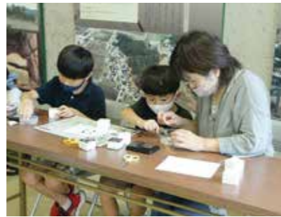
スタンプづくりに熱中する参加者

8月6日、雪舟ネズミのスタンプづくりワークショップが吉備路文化館で開かれました。参加した親子は、輪ゴムやビーズなどを使い、スタンプを制作。出来上がったスタンプで押印し、参加者同士で見せ合っていました。