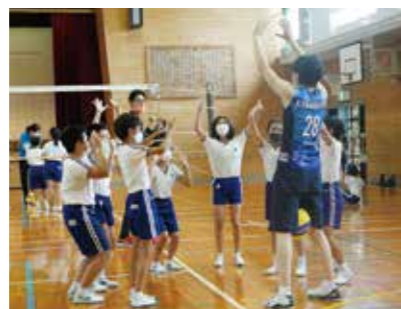
オーバーハンドパスを教わる児童

7月14日、総社北小学校で人権スポーツふれあい教室が開催され、同小の5・6年生が参加しました。児童は、岡山シーガルズの選手と一緒にバレーを体験し、プレーの中で他人への思いやりと絆の大切さを学びました。