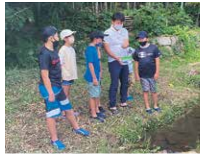
捕まえた魚を観察

7月30日に、山手地区で水辺の教室が開かれました。ホタルが生息できる環境を知ることを目的に、川の水の観察などを実施。川の水をきれいにする山の役割を学び、子どもたちは、環境保全のためにできることを考えました。