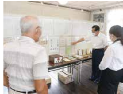
資料の説明を熱心に聞く

8月2日から、まちかど郷土館で、戦前の製薬現場で使用された80点の資料が展示されています。薬の製造や置き薬などの特徴的な販売が盛んだった総社市。来館者は、総社市と薬の関わりなどを学んでいました。