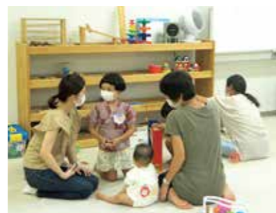
参加者同士で会話を楽しむ

8月8日、インターナショナル子育て広場が天満屋ハッピータウンリブ総社店のなかよし広場ぴよこっで開催されました。タイ・台湾・日本国籍の5組の家族が参加。ゲームや会話を通して、参加者同士で交流を楽しんでいました。