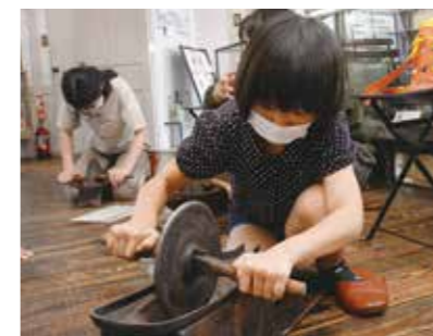
丁寧にヨモギをすりつぶす

8月11日に、夏休みまちかど郷土館講座が行われました。参加者は、薬包紙を使った紙風船づくりや薬研を使用したもぐさづくりを体験。初めて使う道具に戸惑いながらも、興味津々に取り組んでいました。