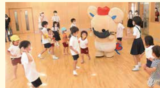
みんな走るのが速くて追いつけなかったよ

放課後児童クラブおひさまに行ってきたんだ。保育園に通う小さい子から小学6年生まで、たくさんの子とふれあえてうれしかったよ。鬼ごっこをしたり、ボール遊びをしたりして、盛り上がったね。高学年の子が小さい子と一緒に遊んであげて、みんなの優しさに心が温まったよ。みんなと楽しく遊ぶことができ、笑顔になれたんだ。また、おひさまに行きたいな。これからも仲良く過ごしてね。