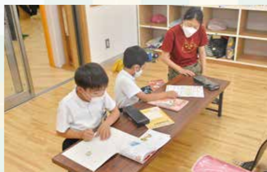
熱心に宿題に取り組む

クラブでは、子どもたちがやりたいことをかなえ、何事にもチャレンジすることを応援しています。また、大家族のような温かい居場所づくりに努めています。設立からクラブを支えてくれている人に喜んでもらえるよう、福祉活動も行っており、地域との交流を深めています。