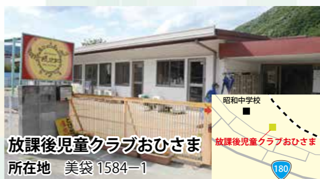
放課後児童クラブおひさま 所在地 美袋 1584-1