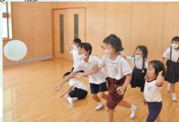
風船めがけてみんなで競争

昭和・維新小学校区の1から6年生までの53人が在籍する放課後児童クラブおひさま。同じ施設で1から6歳までの認可外保育も実施しています。