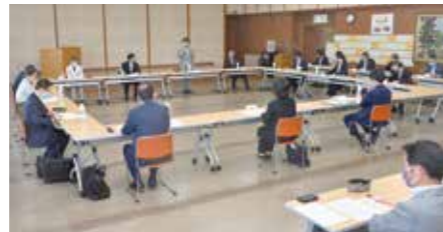
教育委員や市校長会・園長会の代表者が意見を交わした

市は5月24日に、そうじや総合教育会議を総合福祉センターで開催。学校の園児・児童・生徒が新型コロナウイルス感染症にかかった場合の学級閉鎖基準の見直しについて協議しました。 これまでは学級内で陽性者が1人確認された場合、陽性者の最終登校(園)日の翌日から4日間を学級閉鎖としていました。会議では、1人目の最終登校(園)日の翌日から4日以内に同一学級内で2人目の陽性者が確認された場合は、2人目の最終登校(園)日の翌日から4日間学級閉鎖を行うこと、陽性者が1人のみの場合でも、学級内で感染リスクの高い活動を行っている場合は、1人目の陽性者の最終登校(園)日の翌日から4日間の学級閉鎖を行うことなどが提案されました。同会議の提案を踏まえ、教育委員会が協議し、案のとおり新たな基準を決定しました。