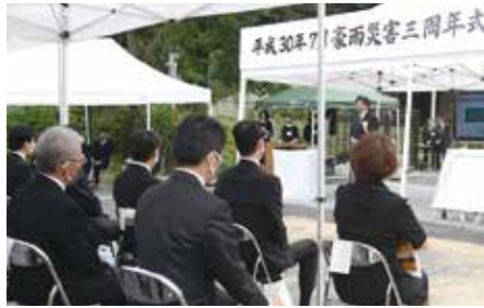
昨年の式典の様子

西日本豪雨から4年を迎えるにあたり、犠牲者の追悼を行うとともに、この災害を風化させることなく後世へ語り継いでいくための式典を行います。