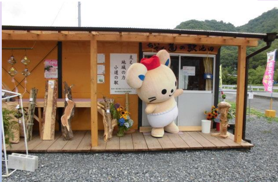
池田地区 小道の駅プロジェクト 〈代表 平田勝彦〉