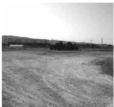
公園整備が進められる雪舟生誕地の全体風景