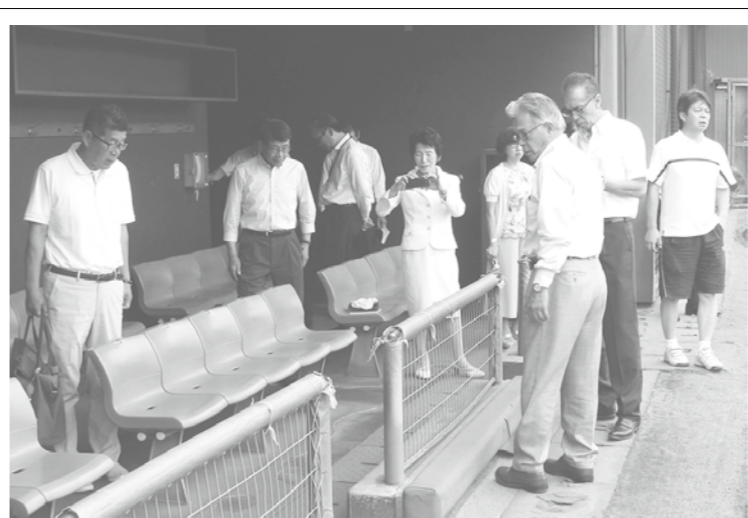
野球場ベンチの設備等を現地調査

ので、まず改修を行う。今後は、学校施設の長寿命化計画を策定し、全体的な見直しの中で改修していく。 問 昭和福祉センター解体が当初予算ではなく補正予算なのはなぜか。 答 昨年度11月補正で解体に伴う設計の予算を計上していたが、設計の工期が3月末だった。不確かな額を当初で