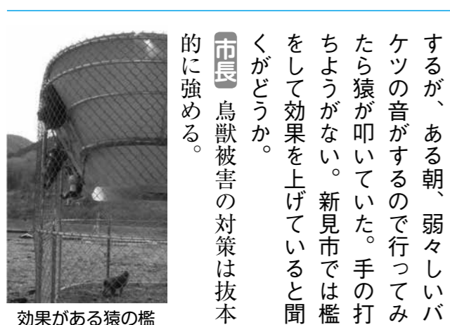
効果がある猿の檻

問 猿が出没したらバケツを叩いたり、花火を飛ばしたりするが、ある朝、弱々しいバケツの音がするので行って見たら猿が叩いていた。手の打ちようがない。新見市では檻をして効果を上げていると聞くがどうか。 市長 鳥獣被害の対策は抜本的に強める。