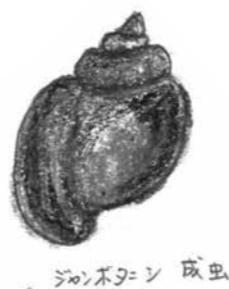
ジャンボタニシ 成虫