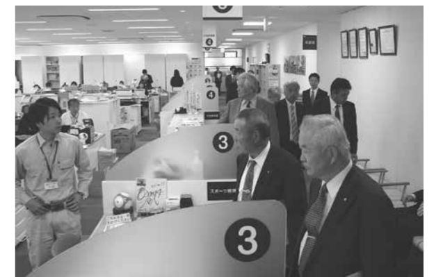
高梁市庁舎内で職員から意見を聴く総務生活委員

住民票や税の証明がインターネットで申請でき、市では、申請を受けた後、郵送で市民に送付できるようになる。