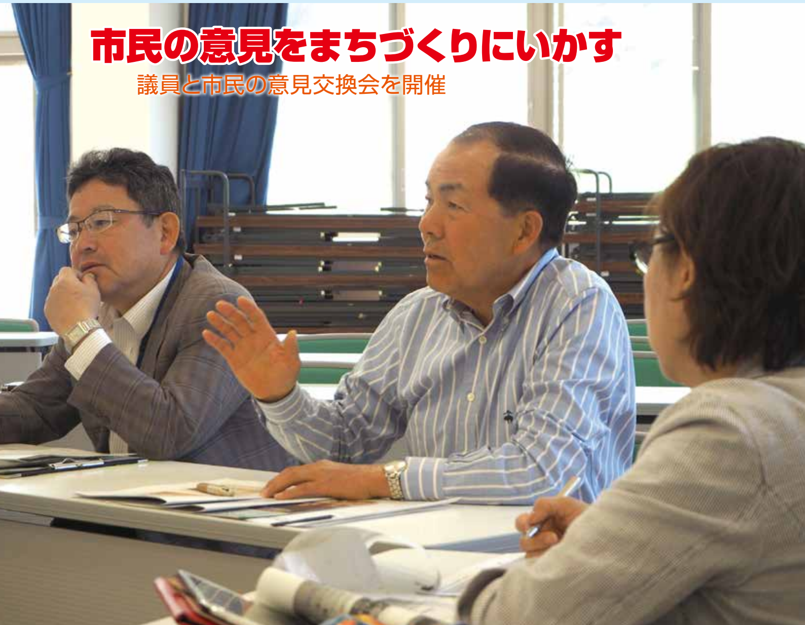
議員と市民の意見交換会(昭和公民館)