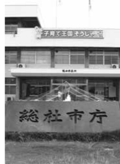
市役所でも働き方改革が求められる

ぎて帰っている先生もいる。 問 今後、県教育委員会と市教育委員会とでどのような対策を考えるか。 教育長 県も本気で働き方改革を進めようとしているので、今がチャンスだと思う。今後、業務削減、アシスタントを付ける業務委託、そして教員の意識改革の3つを進めなければならぬと思う。県、市、学校の三重構造であるが、信頼関係を築き、できるだけ学校に権限移譲するようにして、先生の労働時間を少しでも短くする工夫をしていきたい。