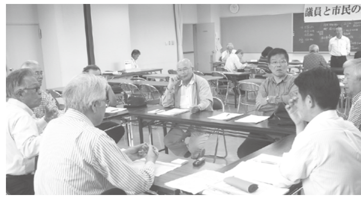
総合福祉センター会場

食調理場などについて、さらに、清音公民館では、三因古墳群の調査や梅雨時期の雨水対策の整備などの意見が出されました。ほかにも、議会活動の活性化、市職員の働き方改革などについて様々な意見がありました。 意見を掘り下げるため各委員会です管事務調査を実施 市民の皆様から頂いたご意