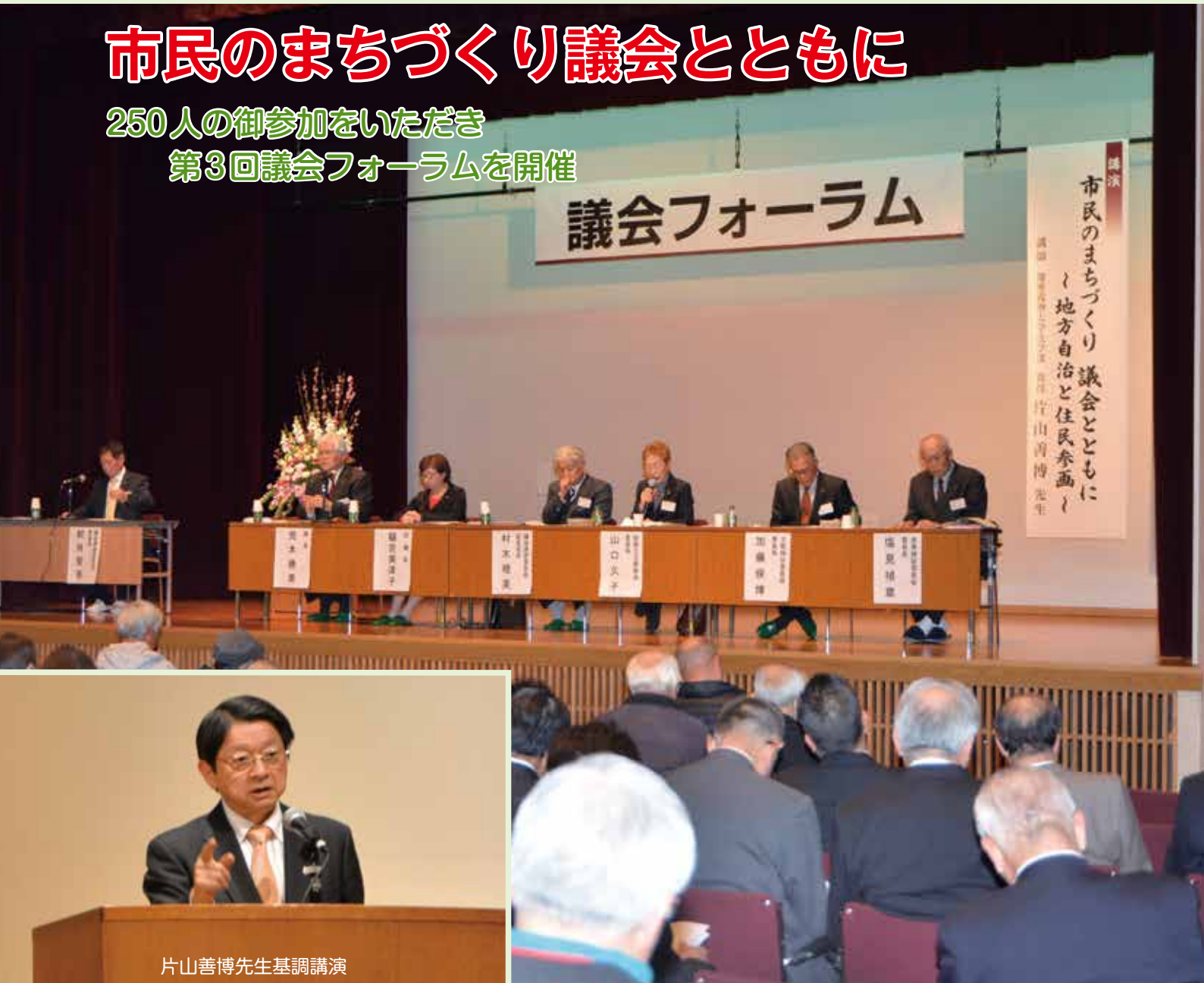
片山善博先生基調講演