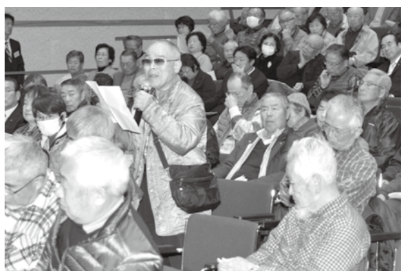
質疑応答を行う参加者

決定するためには関係者の意見を広く聴かないといけません。重要なことを決める人は必ず双方の意見、それから