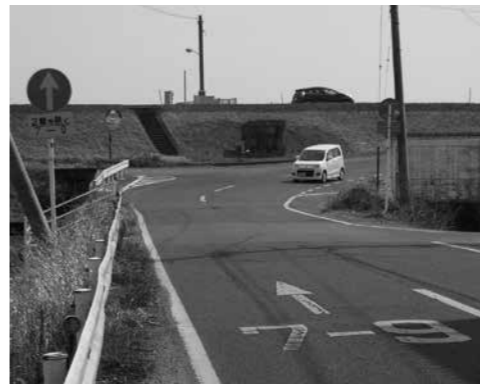
南北道の整備が進められる西部地域