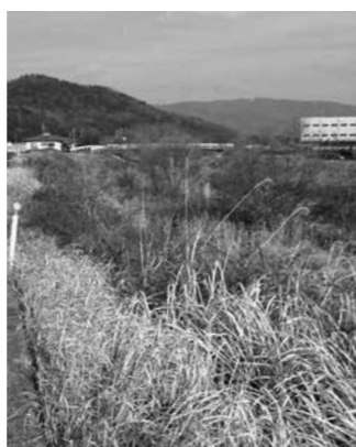
雑草が繁茂する砂川

市長 砂川公園下流の平成橋付近から河川敷に雑草、雑木が生え、長良流通センター付近になると木も大きくなり、美観も損ね、環境等にも悪影響を及ぼしている。県に雑木