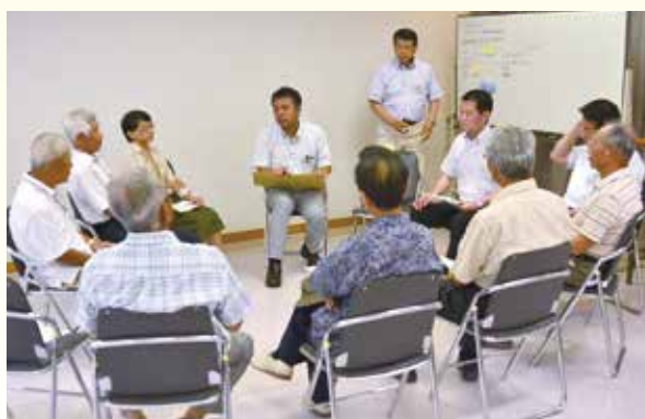
ワークショップ形式の意見交換