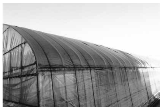
1年ごとに真菌が繁殖し張り替えを余儀なくされるビニールハウス