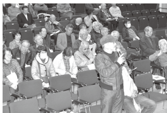
議員と市民の意見交換

らしいの責任感を持って、決定に臨んでほしいと思います。これからの議会と住民参画 日本の議会では住民の参画機会は限られています。議員を選ぶ選挙や議会傍聴などが挙げられます。しかし、傍聴は傍らで傍観するような仕組みになっていきます。市民が本来の主役ですから、これは変えないといけません。また、請願、陳情は、議会の議案として審査決定されますが、その程度です。一方、アメリカの議会では必ず市民に発言の機会が与えられます。住民参画というのは、重要だと思えます。