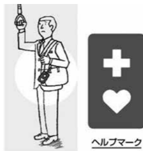
皆に知ってもらいたいヘルプマーク

問 平成28年11月議会での240万円の赤字はどうなったのか。 教育長 野菜価格の低下に