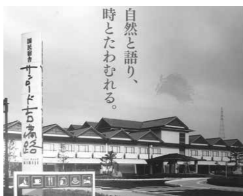
国民宿舎 サンロード吉備路