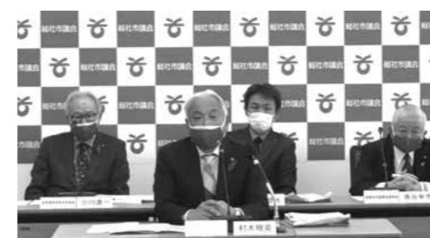
議決結果説明会の様子

12月21日の本会議終了後、総社市議会初の議決結果説明会を実施しました。この説明会は、議会活動の市民への説明責任を果たすとともに、情報の共有化を図るため実施したものです。今後も定例会の審議の状況や議会活動の状況により、随時開催する予定です。