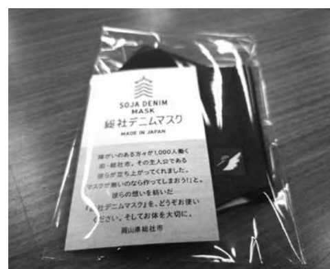
成人記念式限定デニムマスク

「なぜ実行委員になったのか」の質問には、「総社が大好きで、何か人のためになることがしたいから」や、「一人でも多くの同級生に参加してもらいたいから」など、前向きな意見ばかりでした。次の時代の総社を担う新成人の発言を、大変頼もしく感じました。 記念品も自らデザインした特別な総社デニムマスクを用意。趣向を凝らした成人記念式の大成功を心から願います。懇談会に参加した広聴広報委員会のメンバーも当日が非常に楽しになりました。