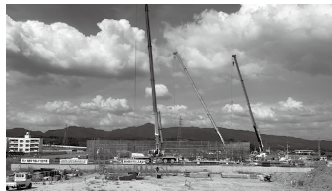
建設が進んでいる長野病院

問 子育て王国そうじゃ宣言を出してはどうか。 市長 本市には「子ども条例」がありそれを子育て王国そうじゃの方向性の基としているものが、今の社会、親が求めているものを表現し、条例の改訂も考えていかなければならないと考えている。 問 子育て王国そうじゃとは何か? 市長 子育て王国そうじゃとは、本来子ども本位のものであるが、それに付け加えて社会のニーズ、親の気持ちに配慮されるだけのものを備えていくことが、子育て王国そうじゃの真髄であるというふうに変化させていかなければならないものと考えている。