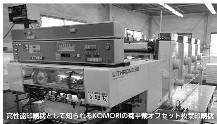
高性能印刷機として知られるKOMORIの菊半裁オフセット枚葉印刷機

600部をオフセット印刷機で印刷していきます。K(墨)からC(藍)M(紅)Y(黄)の順でインキが刷り重ねられていきます。圧巻です。【議会だより】は環境に配慮したベジタブルインクを使用しています。また前号の71号から、より読みやすいように「ユニバーサルデザインフォント」を使用しています。一人でも多くの市民の皆さまに手に取って