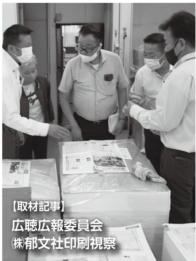
【取材記事】 広聴広報委員会 (株)郁文社印刷視察

7月11日(月)、「議会だより」を製作している(株)郁文社印刷に広聴広報委員会で視察に行きました。記事は我々、広聴広報委員会では、校正・印刷等は郁文社印刷で行っています。記事の修正や校正のやり取りを繰り返し、16ページに及ぶ【議会だより】は完成します。それぞれの工程の説明を受けましたが、特に印刷の工程では、目を見張るものがありました。2万5