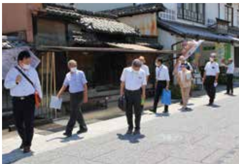
無電柱化した本陣通り

を出発。本陣通りを歩き ながら無電柱化した箇所 も案内していただき、途 中「矢掛ビジターセンタ ー問屋」を訪れ歴史を感 じる建築様式も拝見しま した。