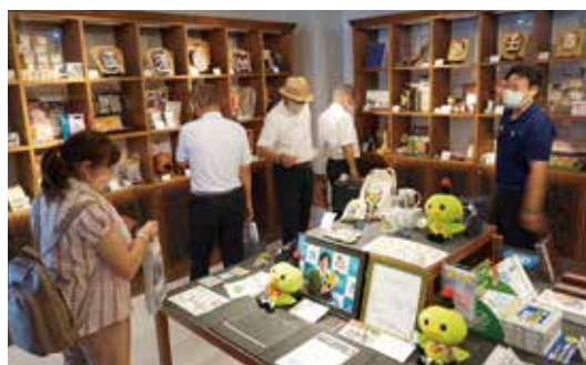
特産品・商店・商品紹介ブース