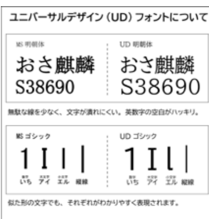
ユニバーサルデザイン(UD)フォントについて MS明体 おさ麒麟 S38690 UD明体 おさ麒麟 S38690 無駄な線を少なく、文字が潰れにくい。英数字の空白がハッキリ。 MSゴシック 1111 UDゴシック 1111 似た形の文字でも、それぞれがわかりやすく表現されます。