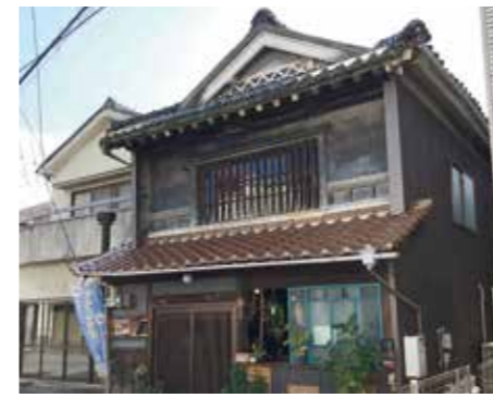
空き家を活用し、創業した店舗

空き家などが適正に管理されず長年にわたり放置され、地域住民の防災・衛生・景観といった生活環境に深刻な影響を及ぼしています。こうしたことから、市は令和4年3月に、空き家に関する対策を総合的かつ計画的に実施するため、総社市空家等対策計画を策定。住民の生命や身体、財産を保護するとともに、良好な生活環境の保全を図ります。