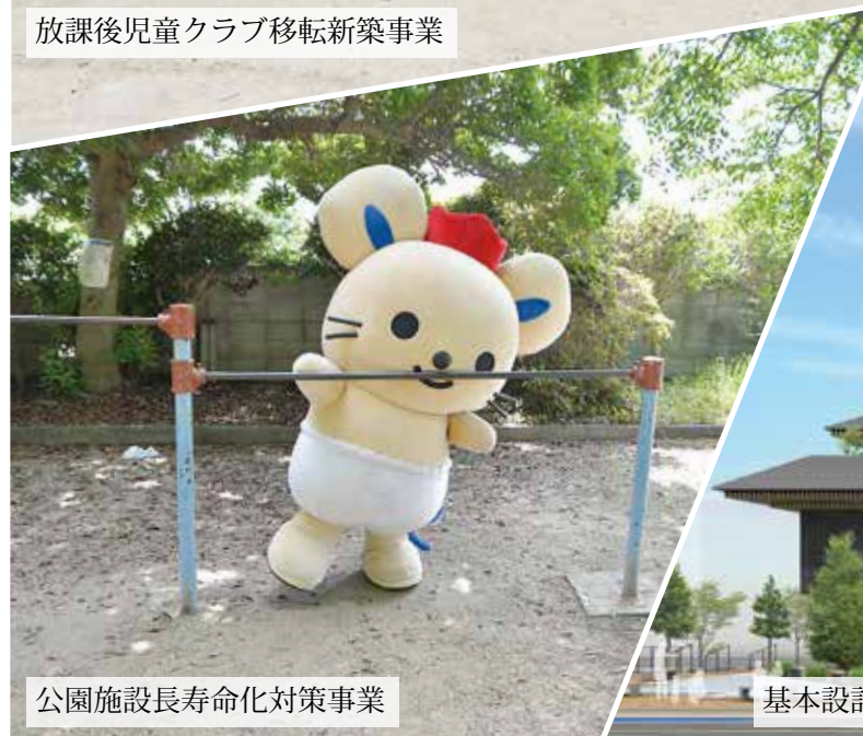
公園施設長寿命化対策事業