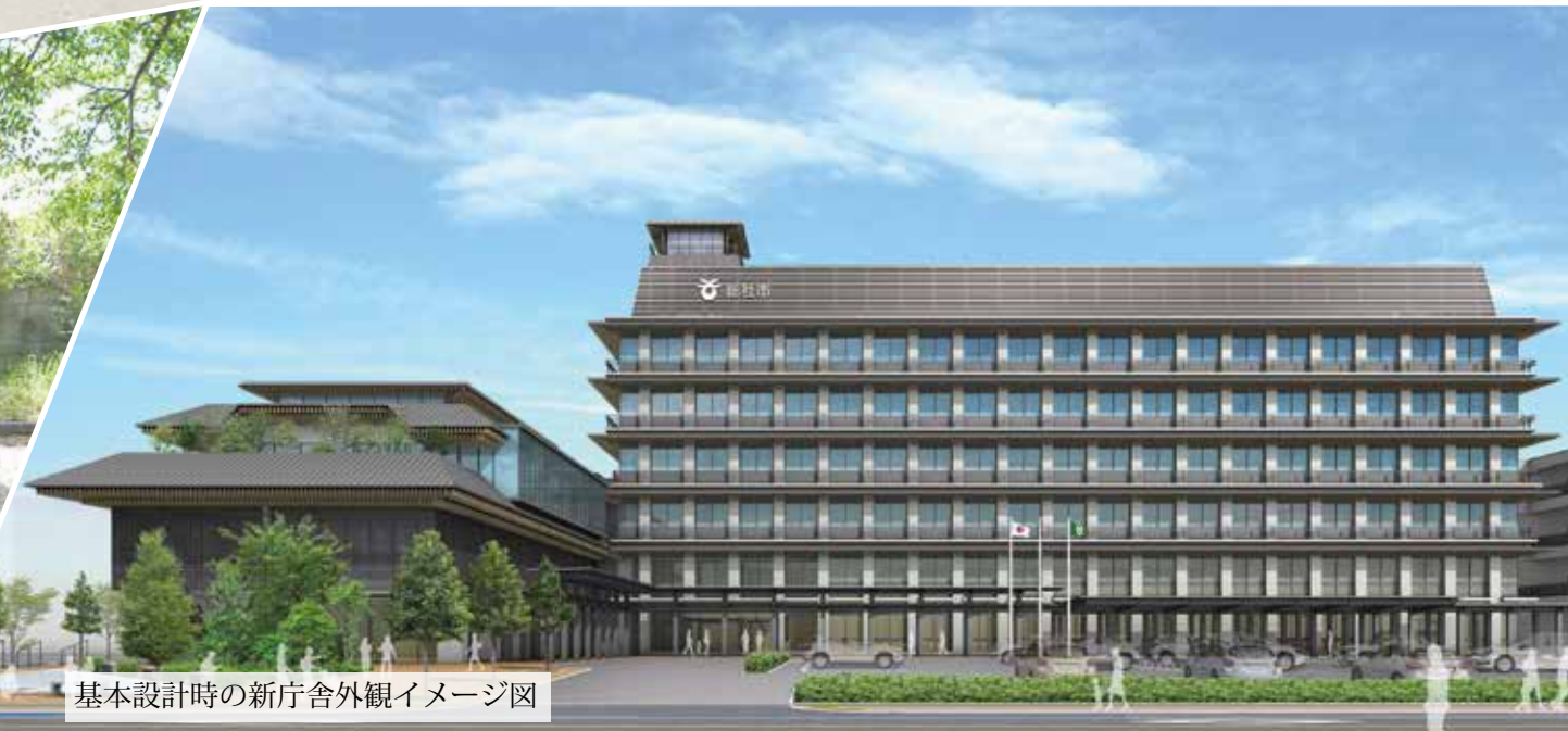
基本設計時の新庁舎外観イメージ図