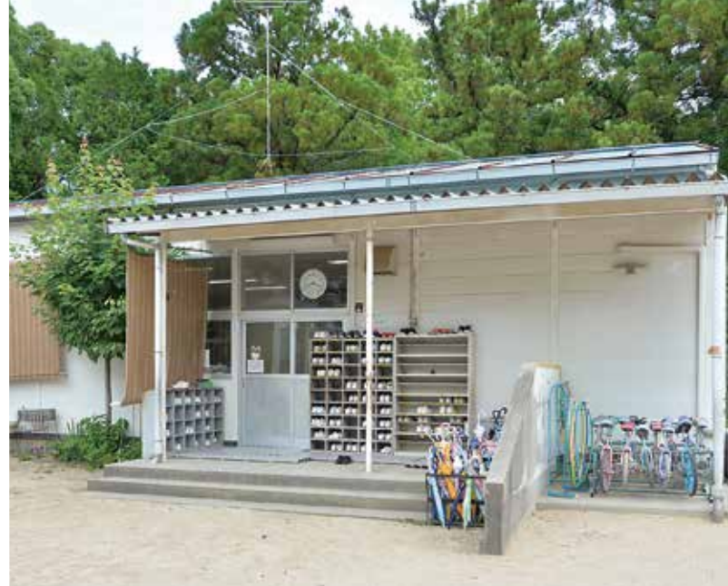
放課後児童クラブ移転新築事業