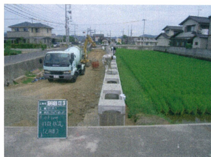
道路側溝部分の整備状況