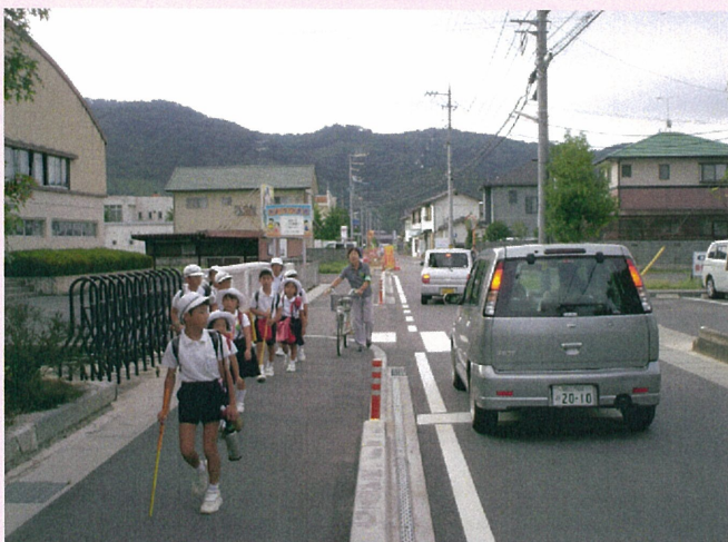
歩道が整備され、安全な歩行空間が確保された