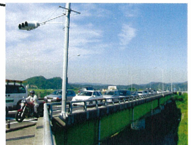
(総社大橋東詰交差点)