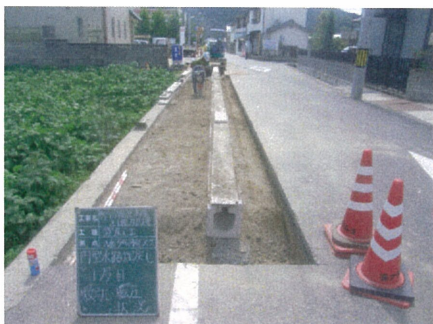
歩道と車道を分離する部分の整備状況