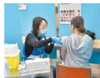
3回目接種を受ける医療関係者

市保健センターで1月8日、新型コロナウイルスワクチンの集団接種が始まり、医療関係者を中心に3回目の接種が行われました。今後、65歳以上の人やその他の人への接種も順次開始する予定です。