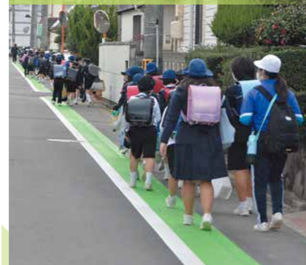
市内に設置されたグリーンベルトと、下校する児童

昨年11月、市内の国道を横断中の園児を含む親子2組が車にはねられ、2人が重体となった事故が発生したことを受け、市では交通安全対策の強化を進めています。