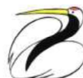
市の鳥 タンチョウ